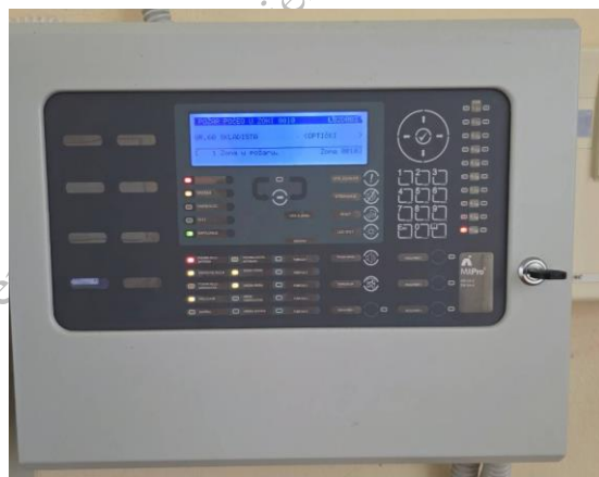
Postojeća vatrodajavna centrala

U objektu TS Trebinje vatrodajavni sustav instaliran je prije 10 godina. Sustav je djelomično ispravan. Sustav vatrodajave temeljen je na dvije uvežene centrala u dva odvojena objekta. Vatrodajavne centrale adresabilne vatrodajavne centrale proizvršitelja Advanced Electronics, model/serija: MxPro 5.