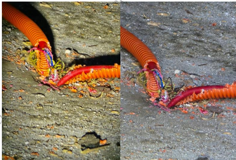
Primjer uništenih instalacija

Na sljedećoj slici dan je primjer štete na instalacijama.