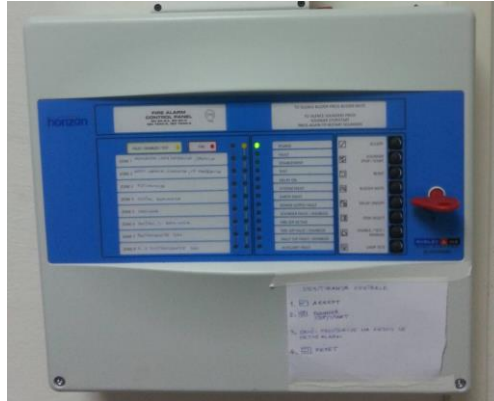
Postojeća vatrodajavna centrala

U objektu TS Grude vatrodajavni sustav instaliran je prije više od 15 godina. Vatrodajavna centrala je ispravna ali su pojedini javljači van funkcije. Vatrodajavna centrala je konvencionalna vatrodajavna centrala proizvođača Morley IAS "Horizon" serija sa 8 zona. : Horizon – Morley IAS vatrodajavna centrala. Kabelske trase koje se nalaze u potkrovolju objekta su „pokidane“ od strane glodavaca i iste je potrebno zamijeniti i ispitati.