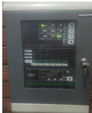
Postojeća vatrodajavna centrala

Na centralu je spojen 31 optički javljač, koji su podijeljeni u 6 zona. Potrebno je zamijeniti vatrodajavnu centralu, dodati dvije trube (jedna unutrašnju i jednu vanjsku), dodati ručni javljač, ispitati sistem, i po potrebi zamijeniti ostale komponente sistema.