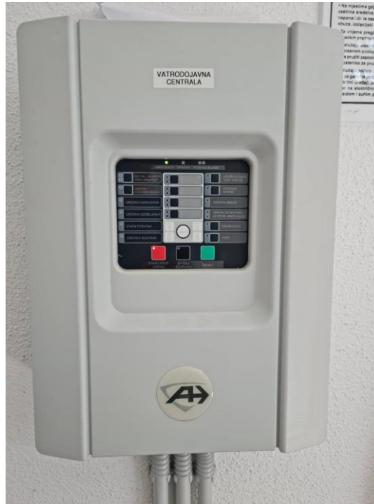
Postojeća vatrodojavna centrala

U objektu TS Mostar 9 vatrodojavni sustav instaliran je prije 10 godina. Vatrodojavna centrala nije ispravna. Dosadašnja vatrodojavna centrala bila je konvencionalna tipa VC, proizvršitelja AJP. Potrebno je zamijeniti vatrodojavnu centralu, ispititi sustav i po potrebi zamijeniti ostale komponente sustava.