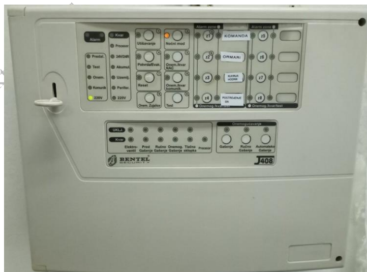
Postojeća vatrodajvna centrala

U objektu TS Sokolac vatrodajvni sistem instaliran je prije 18 godina. Vatrodajvna centrala je ispravna. Dosadašnja vatrodajvna centrala bila je konvencionalna tipa J408, proIzvršitelja Bentel Security. Potrebno je zamijeniti vatrodajvnu centralu, ispitati sistem i po potrebi zamijeniti ostale komponente sistema.